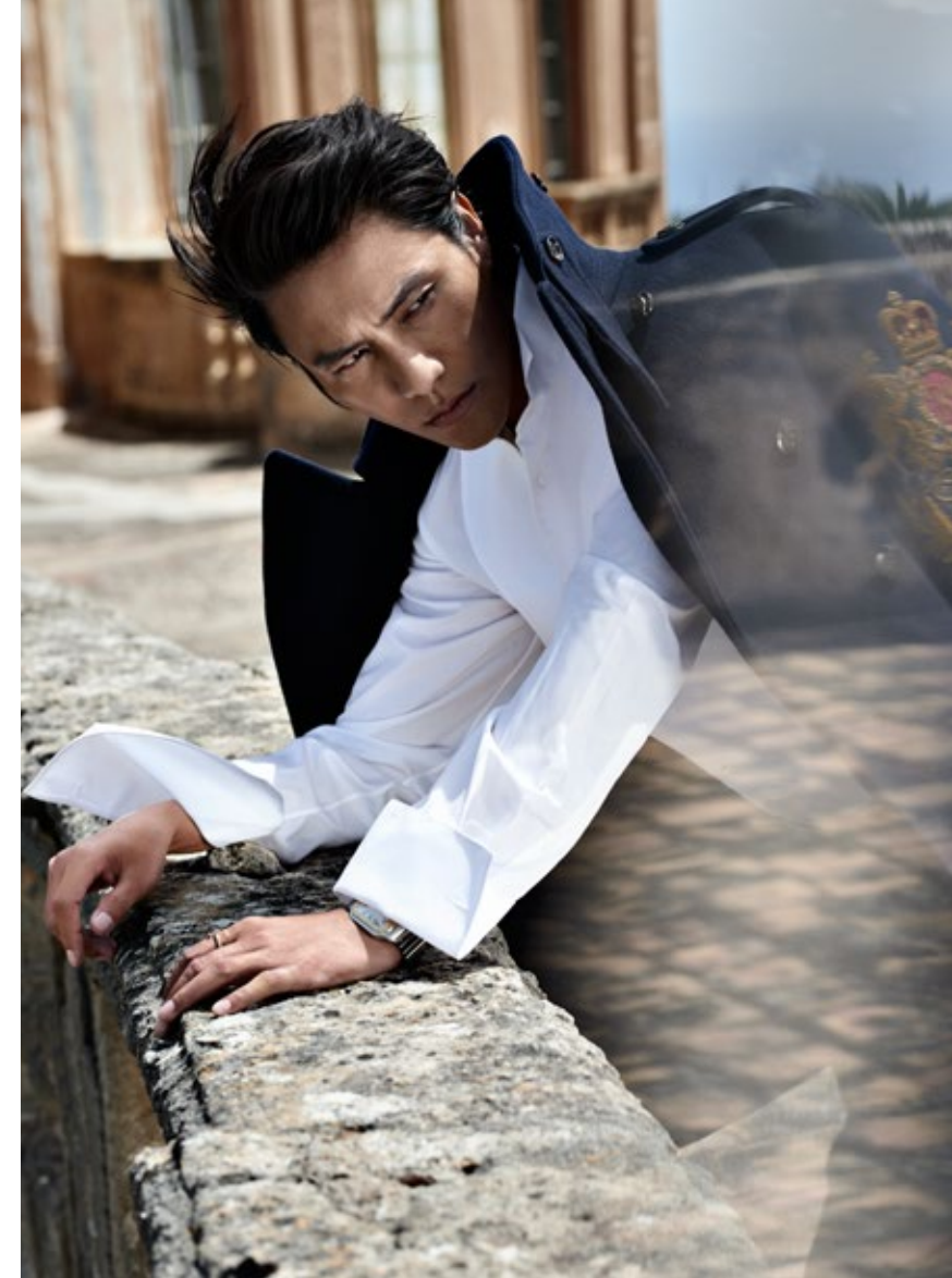
黑色羊毛双排扣外套、白色礼服衬衫、深灰色长裤 Ralph Lauren 18K金与精钢Santos de Cartier系列腕表大号表款 Cartier

和周遭的觉察,感受到他人的喜怒哀乐,同时观察自我的变化。“觉察自我的时候,这个戏不会停止,一直在自然流动,这是我的天性。”