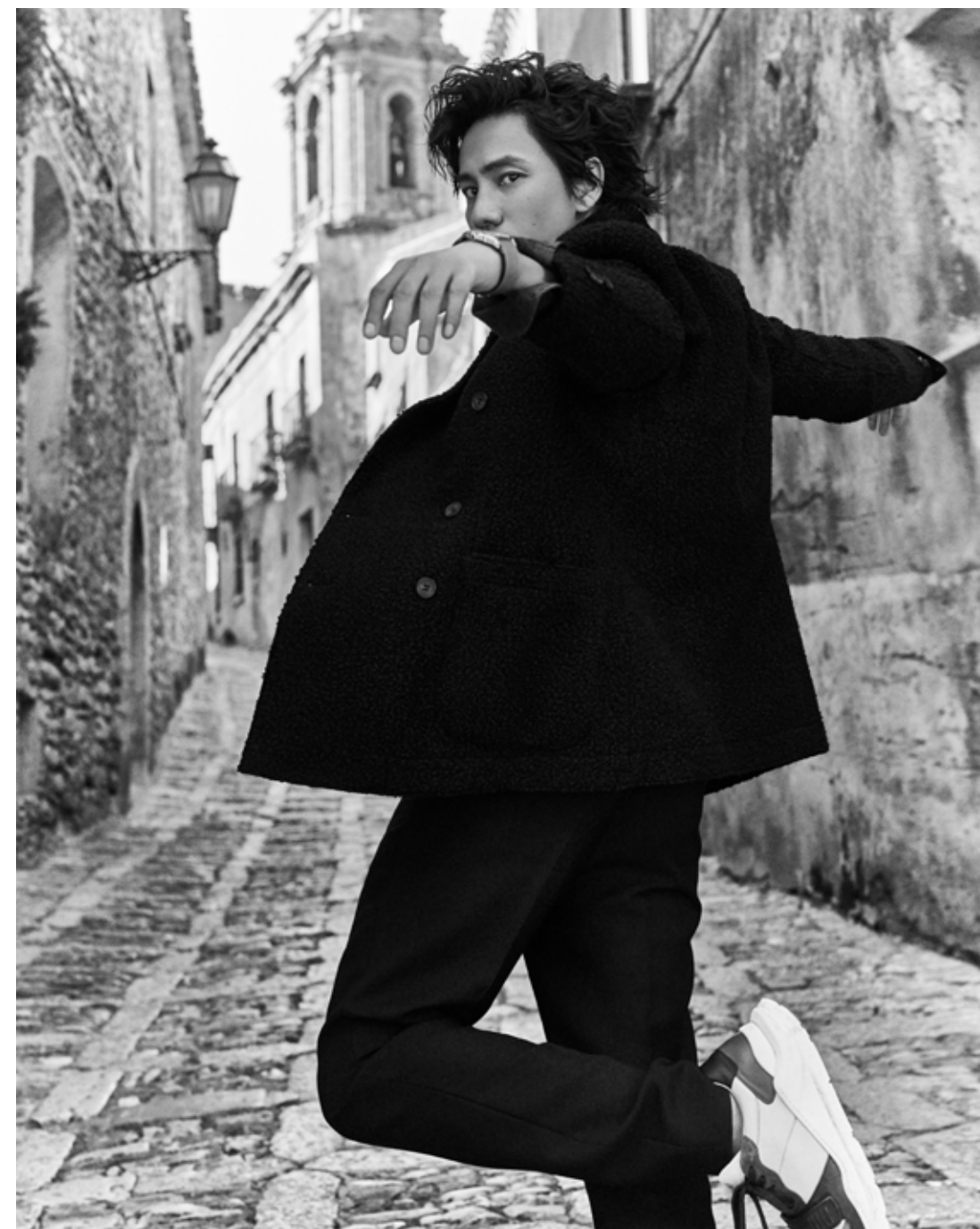
黑色羊毛双排扣西服外套 Emporio Armani 黑色西服长裤 Louis Vuitton 白色拼接运动鞋 私人物品 18K金与精钢Santos de Cartier系列腕表大号表款 Cartier