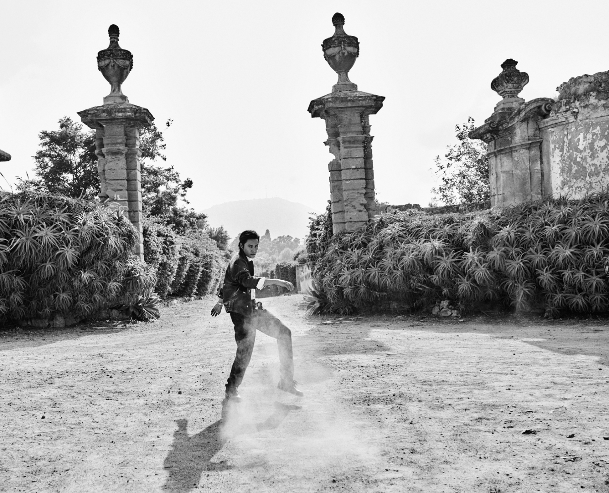
黑色皮质夹克 白色衬衫 深灰色长裤 黑色皮鞋 Cerruti 1881