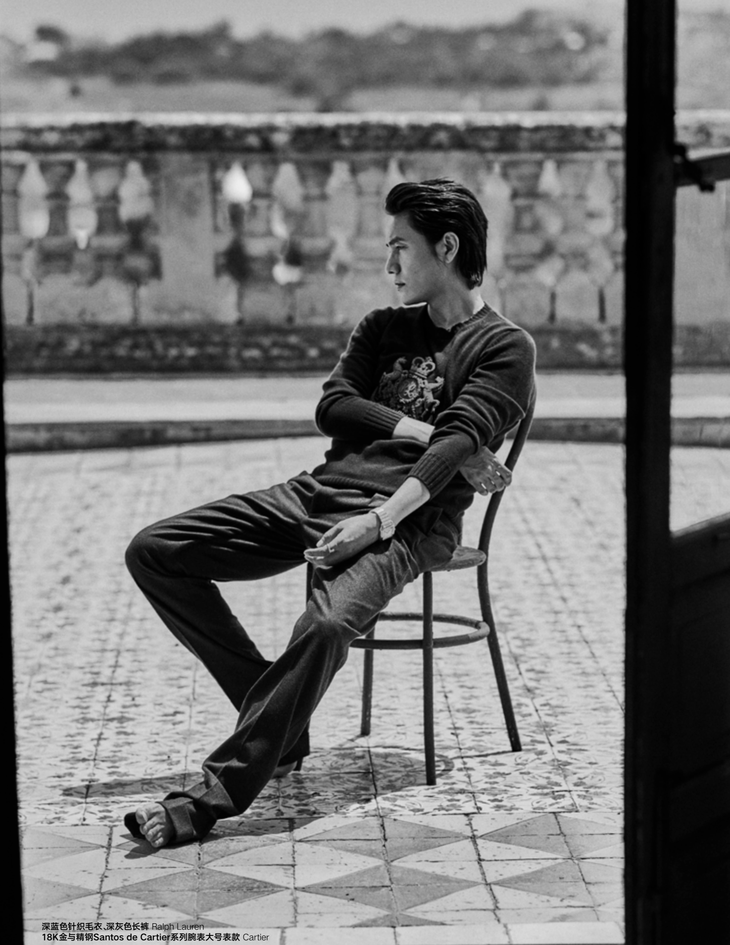
深蓝色针织毛衣、深灰色长裤 Ralph Lauren 18K金与精钢Santos de Cartier系列腕表大号表款 Cartier