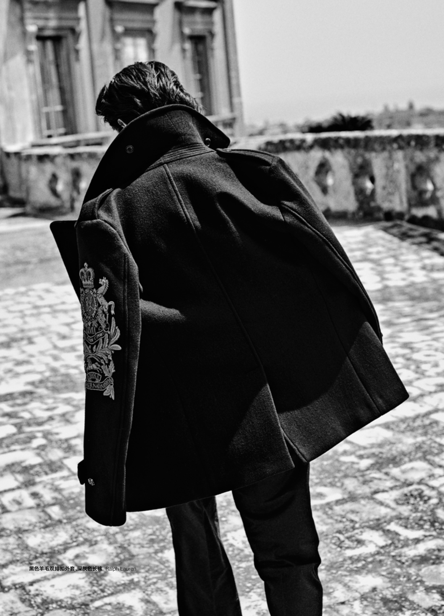
黑色羊毛双排扣外套、深灰色长裤 Ralph Lauren

一笔的想法言论,不晦涩也不深奥,就是有趣,他厌恶造作,所以很诚实地承认,自己这些年来确实是做了很多仿佛本行之外的事情。