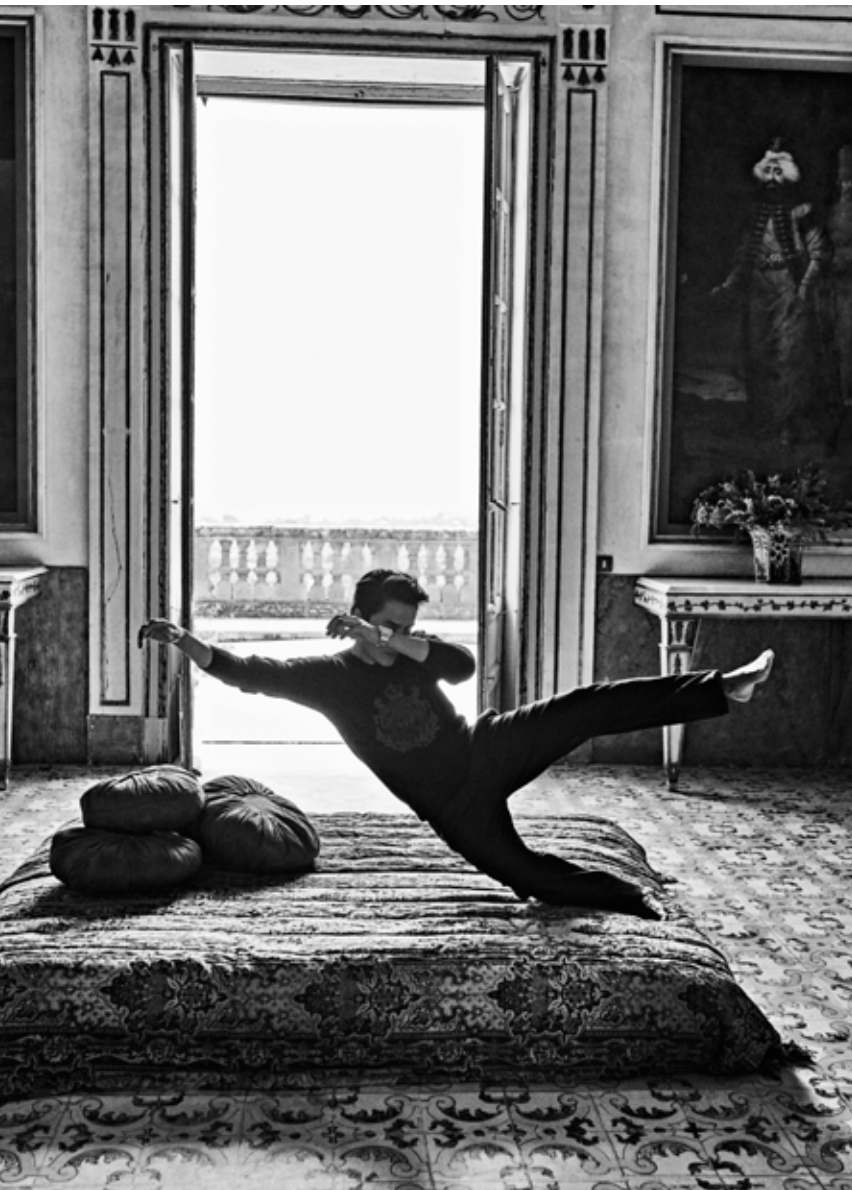
深蓝色针织毛衣、深灰色长裤 Ralph Lauren 18K金与精钢Santos de Cartier系列腕表大号表款 Cartier