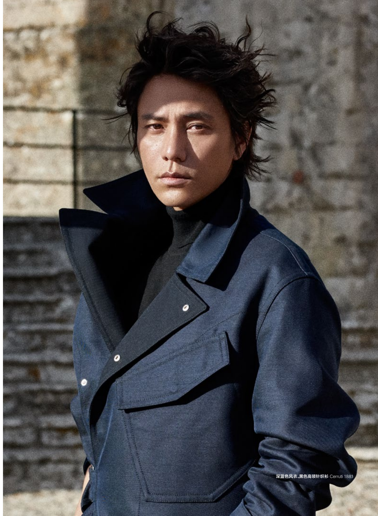
深蓝色风衣、黑色高领针织衫 Cerruti 1881

“从山上下来,就要山下了。”陈坤自己说出这句话,也忍不住乐了。这个人有时候会有一些神来